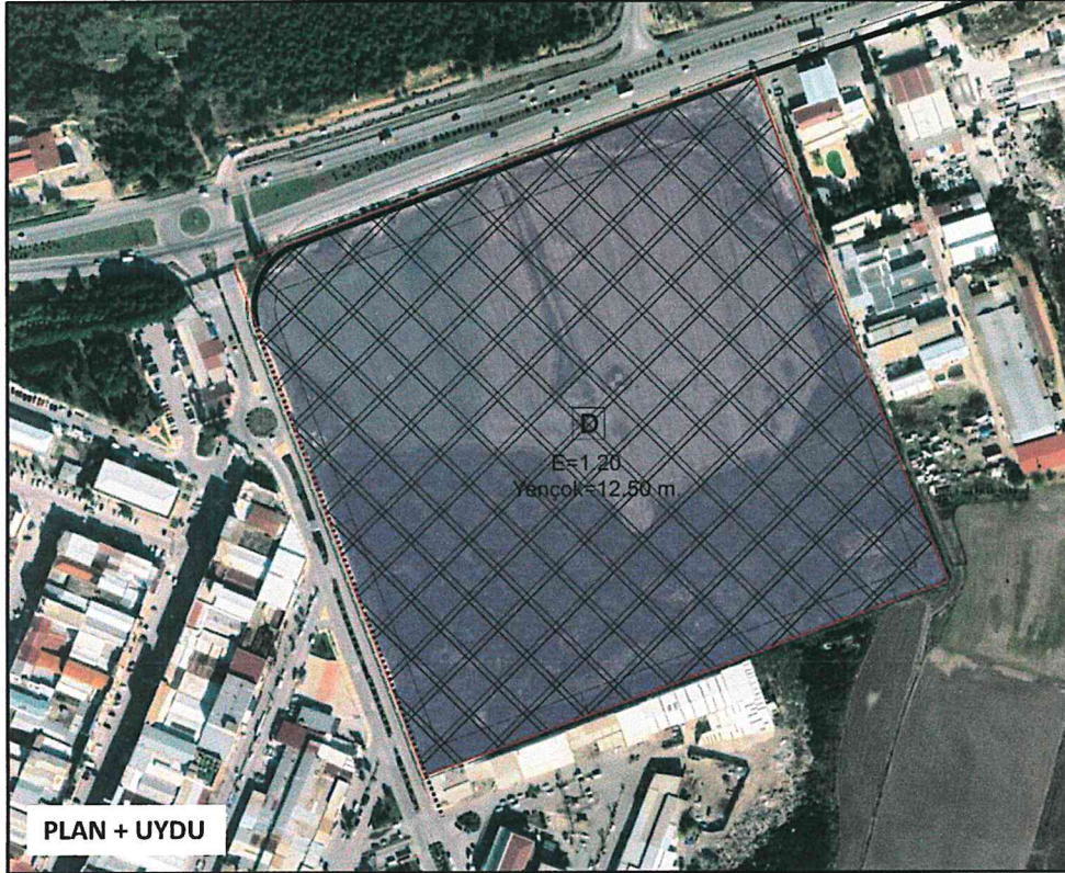
PLAN + UYDU